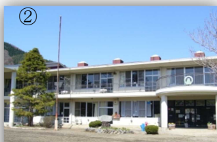
校庭と遊具がかわいくてアットホームです。