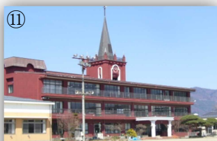
すてきな塔が、よく目立ちます。