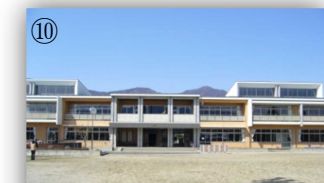
校庭を囲む階段で遊んだり休んだり！