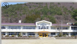
校舎の前の階段から校庭が一望！