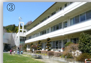
芝生の校庭が青々として気持ちがいい！