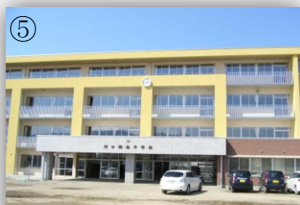
校舎の新築で一層過ごしやすく！