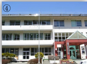
高台から見える河口湖は最高！