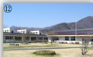
中庭の芝生で一休みしたくなります。