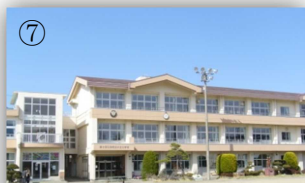
富士山と桜の木の景色にうっとり！