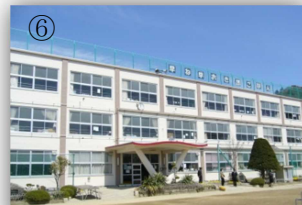
町の真ん中で駅から近くて便利です。