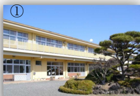
富士山が大きく裾野まで見えます

皆様に町内の小学校8校・中学校4校の雰囲気を味わっていただきたいと思います。さて、どの学校かわかりますか。