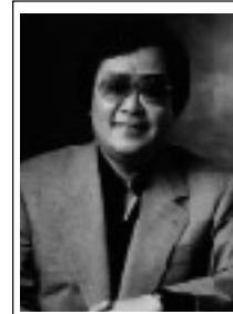
脚本家 ジェームス三木 さん

TVドラマ受賞作品 「けものみち」テレビ大賞優秀番組賞(82) 「湾つくし」第7回日本文芸大賞脚本賞(86) 「父の詫び状」プラハ国際テレビグランプリ(87) 「独眼竜政宗」プロデューサー・協会特別賞(88) 「八代將軍吉宗」第6回日本文芸大賞(96) 「憲法はまだか」「存在の深き眠り」 放送文化基金賞脚本賞(97) 第50回NHK放送文化賞(99) 「弟」第3回橋田賞大賞、 エランドール賞特別賞(05)