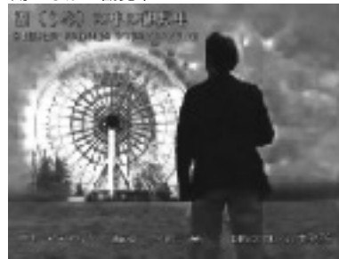
湖のなかの観覧車