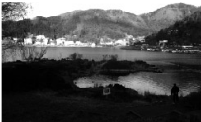
河口湖(船津浜)「豊岩」

この船津溶岩の上面からは、平安時代の遺跡が発見された事例があります(上ノ段下遺跡)。溶岩が流れ込んだ後、しばらく時代を空けて再びこの地域に人々が居住するようになったことが分かります。