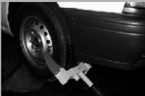
自動車の差押え例(タイヤロックによる運行禁止措置)

また、場合によっては、職員が滞納者の自宅等を強制的に搜索して、発見した財産を差押え・搬出し、公売することも行います。